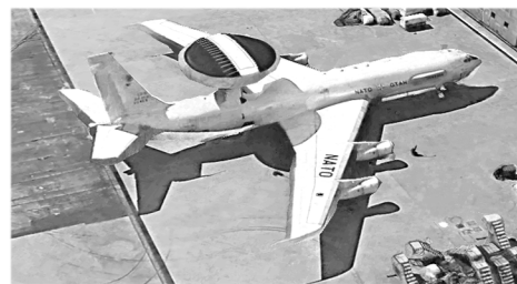
screenshot Google earth

Insomma, nel momento storico in cui la tecnologia e la cibernetica dimostrano la loro essenza in quanto dispositivi di morte , esprimendo il loro reale significato nel genocidio automatizzato che sta sterminando il popolo palestinese su indicazione algoritmica , questo contratto che dà nuovi strumenti cibernetici a "vecchie" macchina da guerra, è sintomo del periodo in cui viviamo, quello della guerra "intelligente" alla vita .